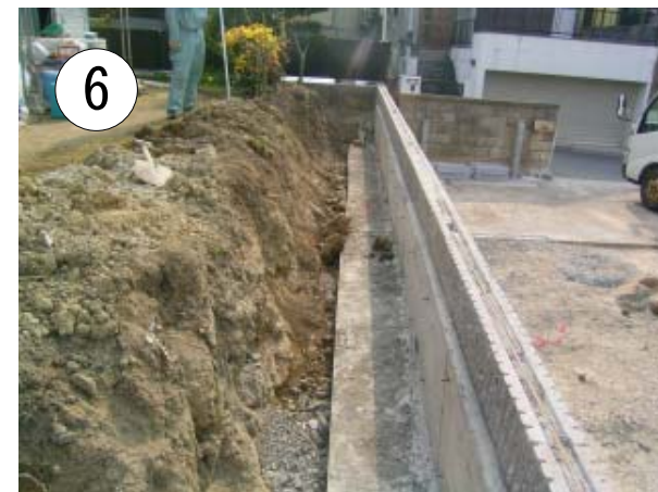
養生期間が過ぎたら . . . 型枠を外すと擁壁の出来上がり . . .