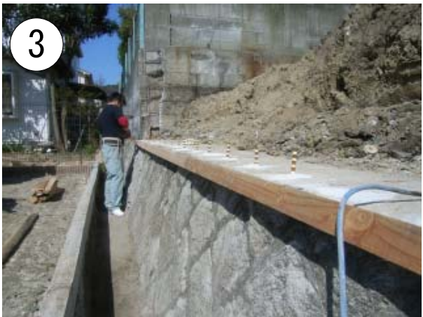
ケミカルアンカーでしっかりとした石積みと新しく作る擁壁を一体化させます . . . .