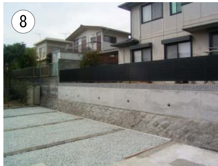
新しいフェンスを設置して . . . . 完成です