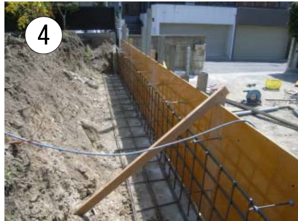
ケミカルアンカーと繋いで鉄筋を組み型枠を組みます