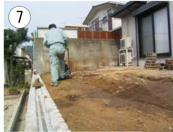
しっかり転圧しながらの埋戻 . . . .