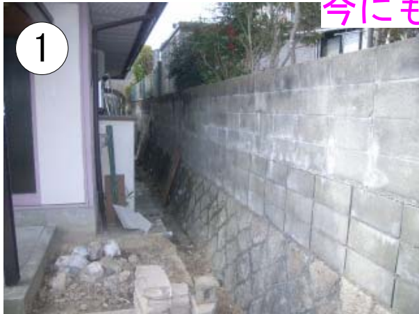
今にも倒壊しそうな昔のブロックを積んだ擁壁です

今にも倒壊しそうなブロックの擁壁をゴジラが蹴飛ばしても大丈夫なコンクリートの擁壁に . . . .