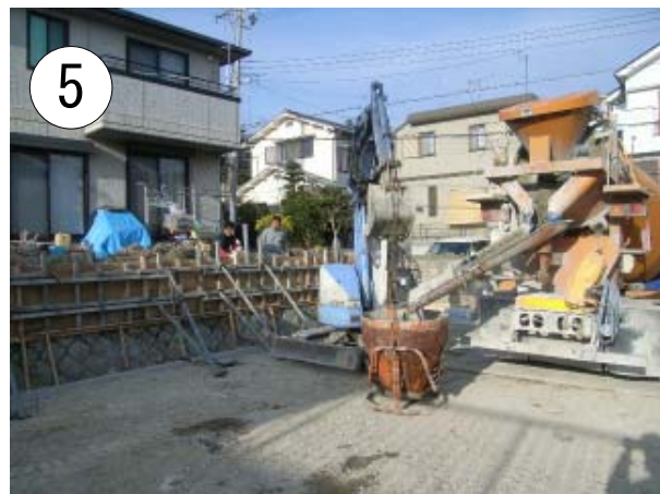
型枠が組めたらコンクリートを流し込みます . . . .