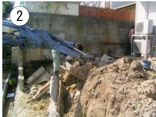
倒れそうなブロック撤去 ※倒れ層とそうなのに撤去はなかなか手ごわい . . . .